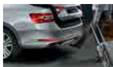
Virtuální pedál – bezdotykové otevírání 5. dveří