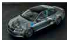
Adaptivní podvozek – volitelné nastavení podvozku ve 3 režimech (Comfort, Normal, Sport)

ŠKODA usnadňuje život svým zákazníkům každý den.