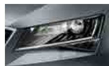
Smart Light Assist – automatické přepínání a clonění dálkových světel